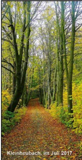
Kleinheubach, im Juli 2017

Die Beisetzung findet am 29.7.2017 um 13.30 Uhr auf dem Friedhof in Kleinheubach statt.